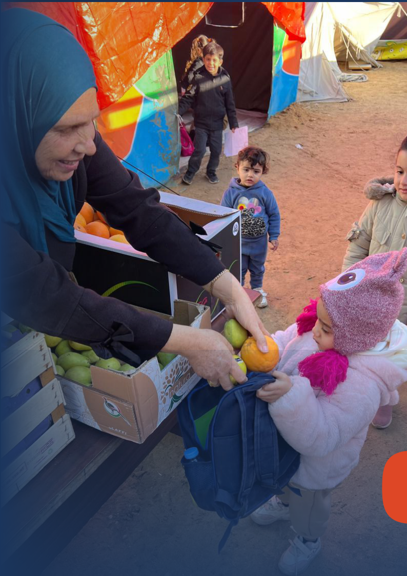
Distribution de fruits aux élèves à l'école d'urgence Habiba School à Gaza.