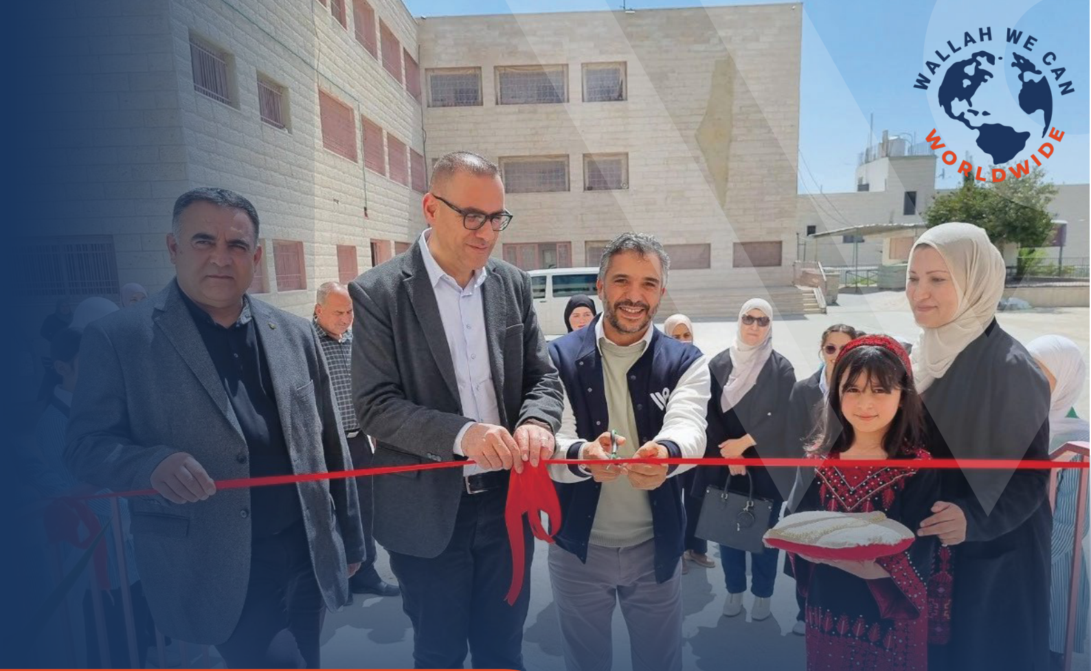
Inauguration école « Palestine » à Dura