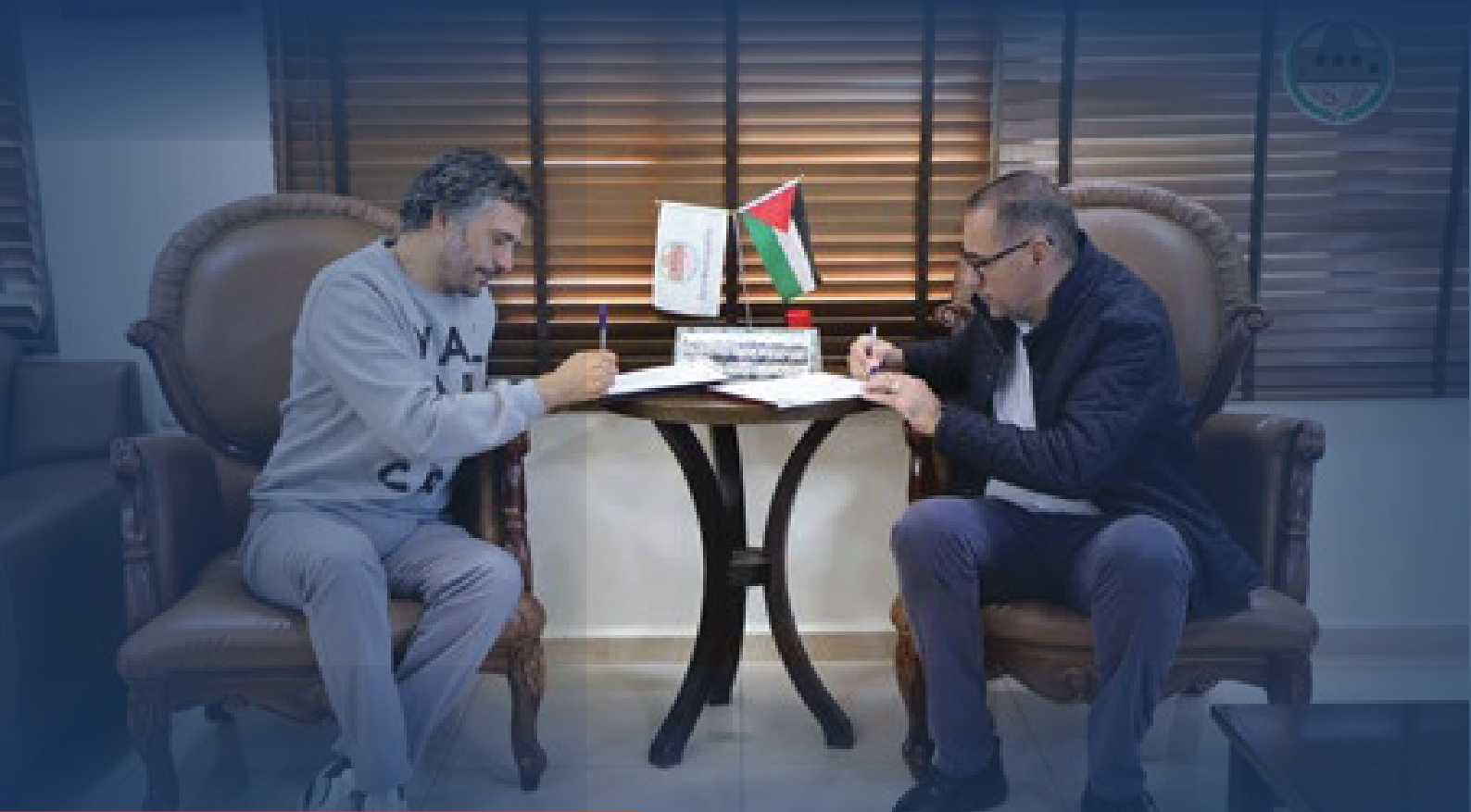
Accord avec la municipalité de Dura