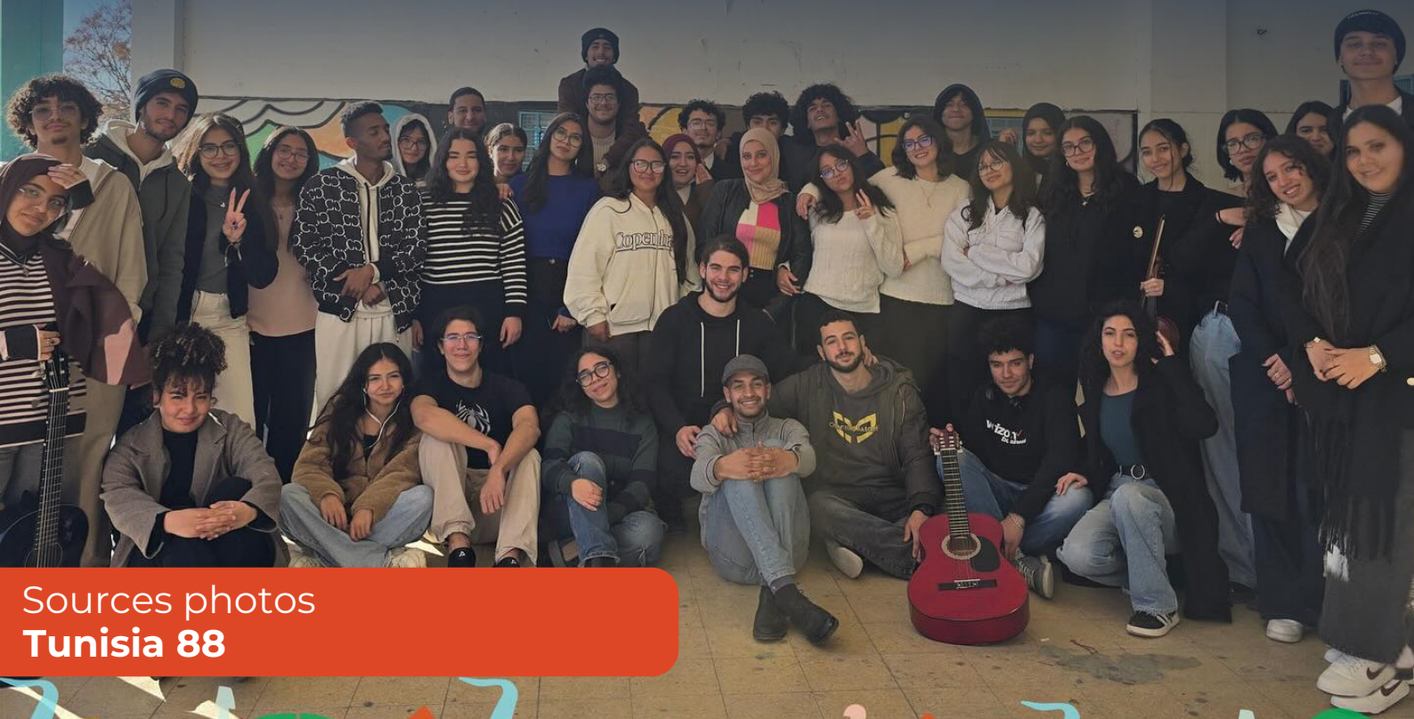
Sources photos Tunisia 88