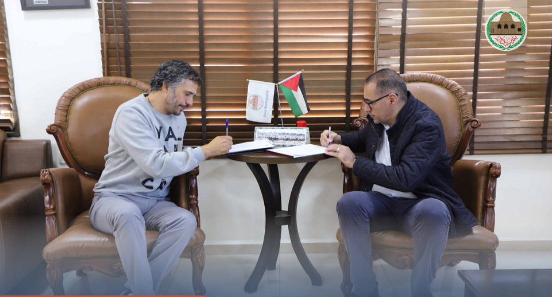
توقيع اتفاق مع بلدية دورا.