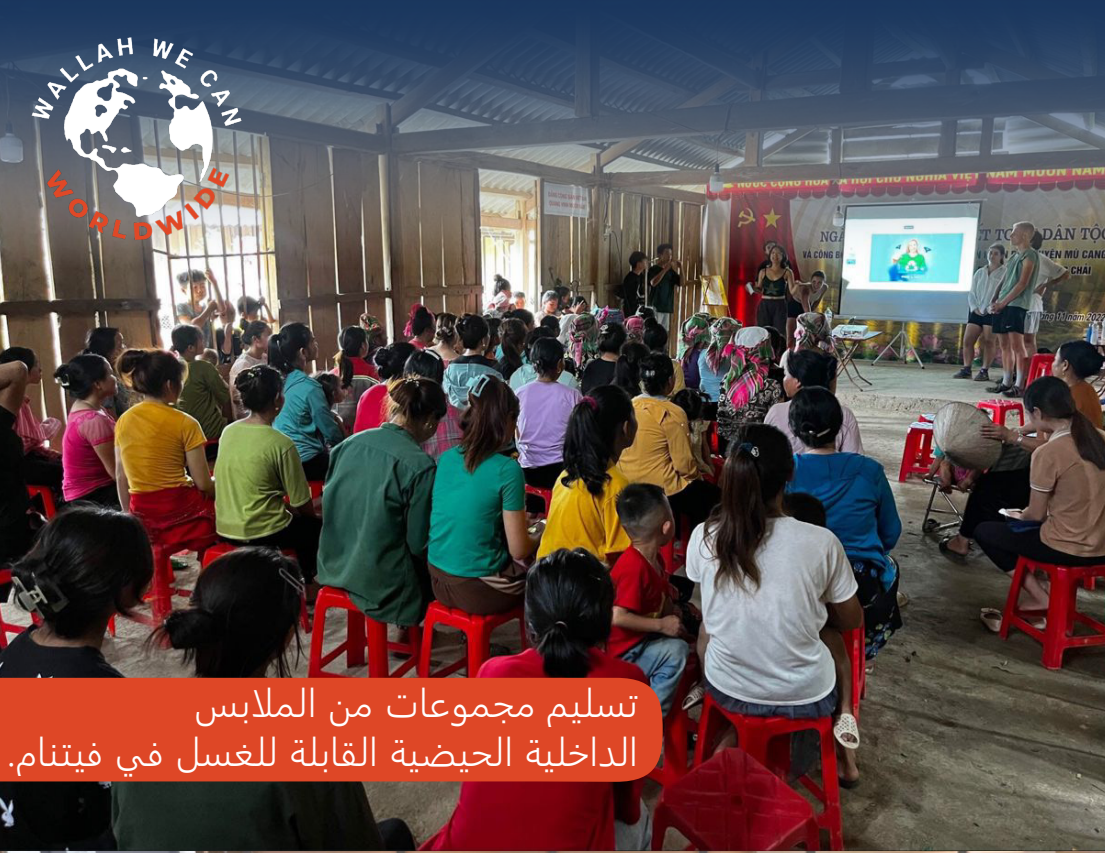
تسليم مجموعات من الملابس الداخلية الحوضية القابلة للغسل في فيتنام.