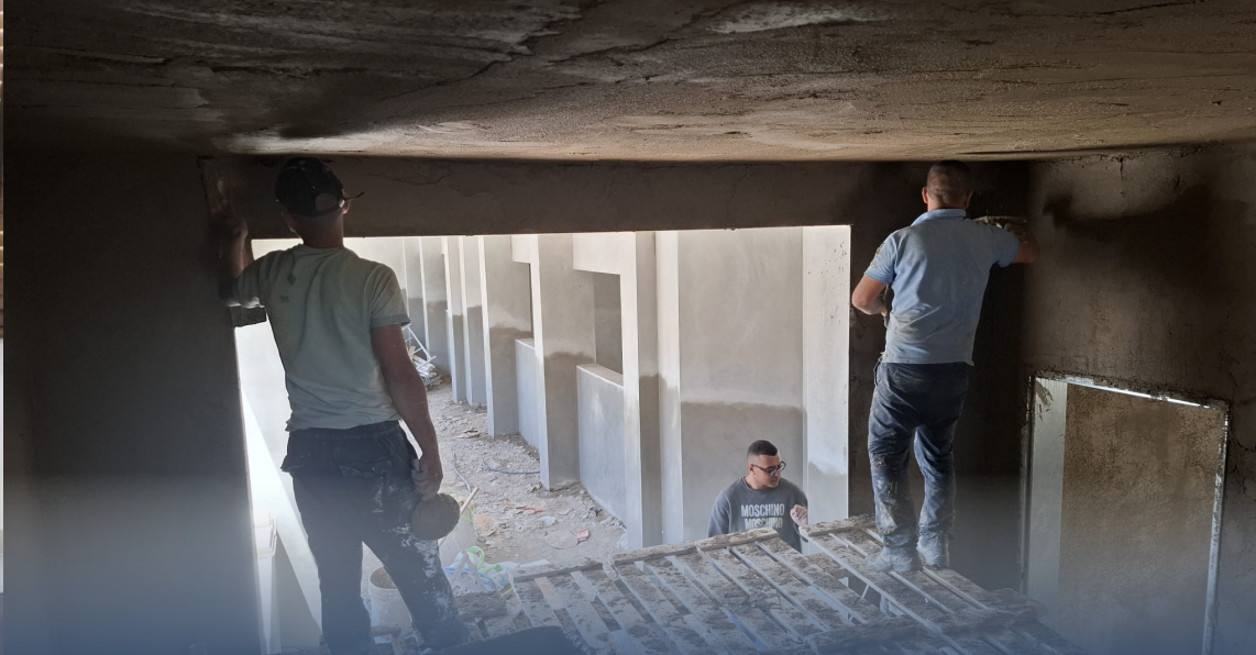
أشغال مدرسة "فلسطين" في دورا.