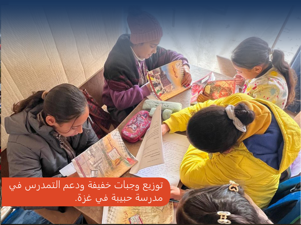
توزيع وجبات خفيفة ودعم التمدرس في مدرسة حبيبة في غزة.