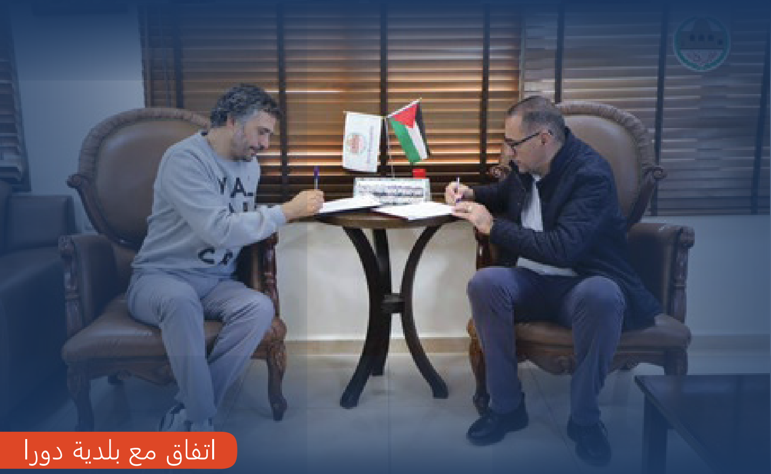
اتفاق مع بلدية دورا