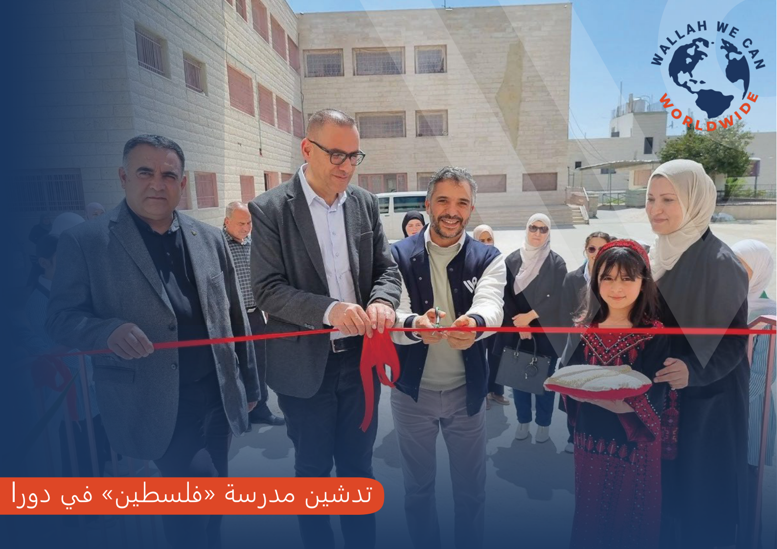
تدشين مدرسة «فلسطين» في دورا