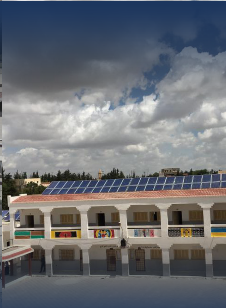
مدرسة GreenSchool في مكثر