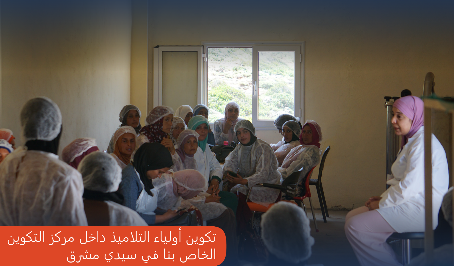
تكوين أولياء التلاميذ داخل مركز التكوين الخاص بنا في سيدي مشرق