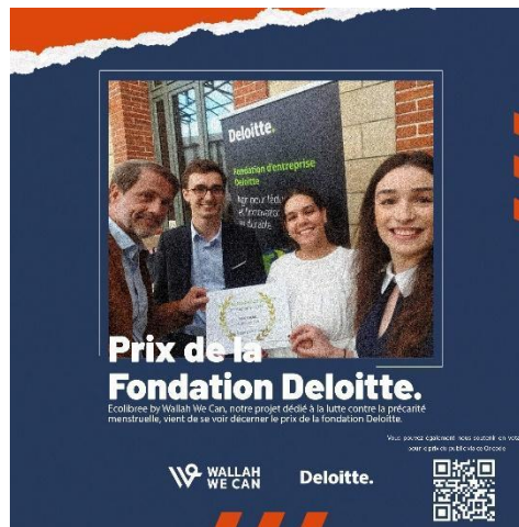
Figure 2 : Le prix de la Fondation Deloitte