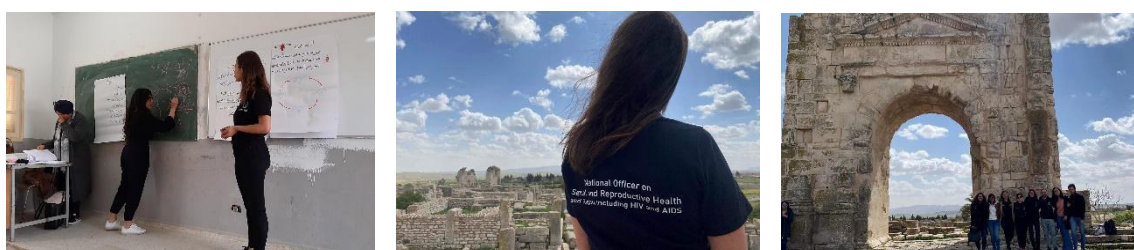
Figure 1 : Aperçu de l'action organisée avec AssociaMed