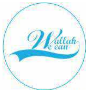
Association Wallah We Can