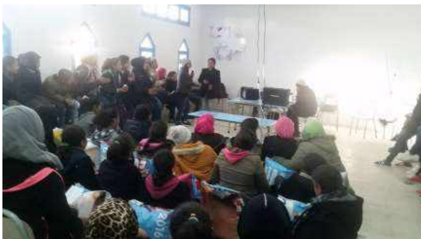
ILLUSTRATION : LES ACTIVITES DU CLUB INFORMATIQUE

En moyenne une trentaine d'élèves participent aux activités dont une vingtaine de manière régulière. Les ateliers sont animés par deux formateurs. Les élèves y prennent part de manière active.